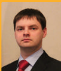
Торопчин Артем Олегович председатель исполкома, первый вице-президент Паралимпийского комитета России