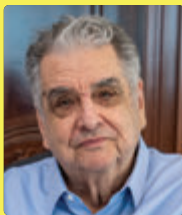
Аганбегян Абел Гезевич