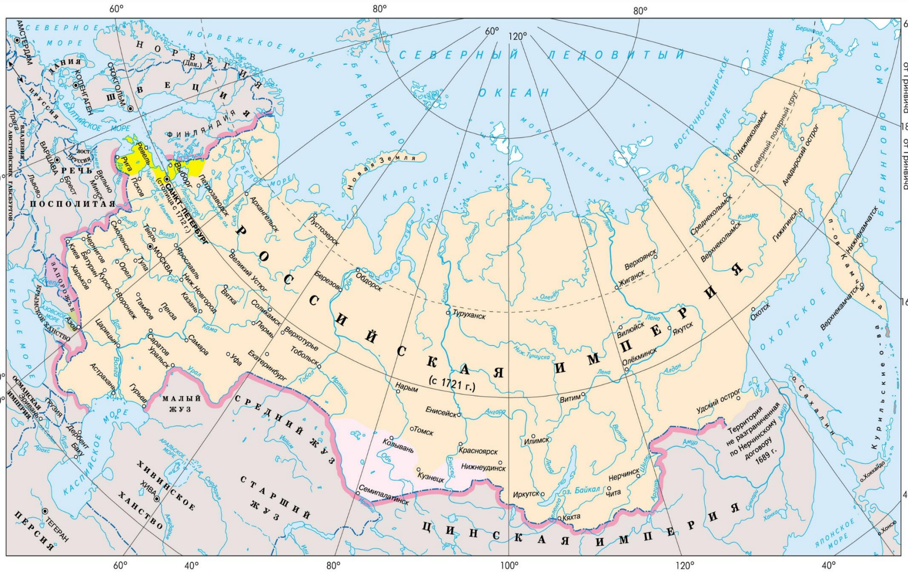
Масштаб 1:32 000 000