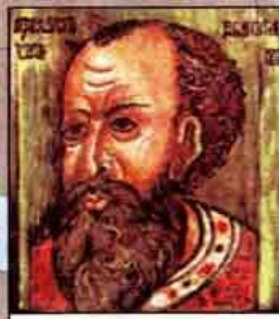
Царь Иван IV