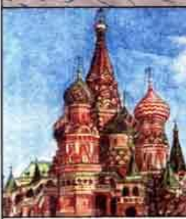
Собор Василия Блаженного в Москве